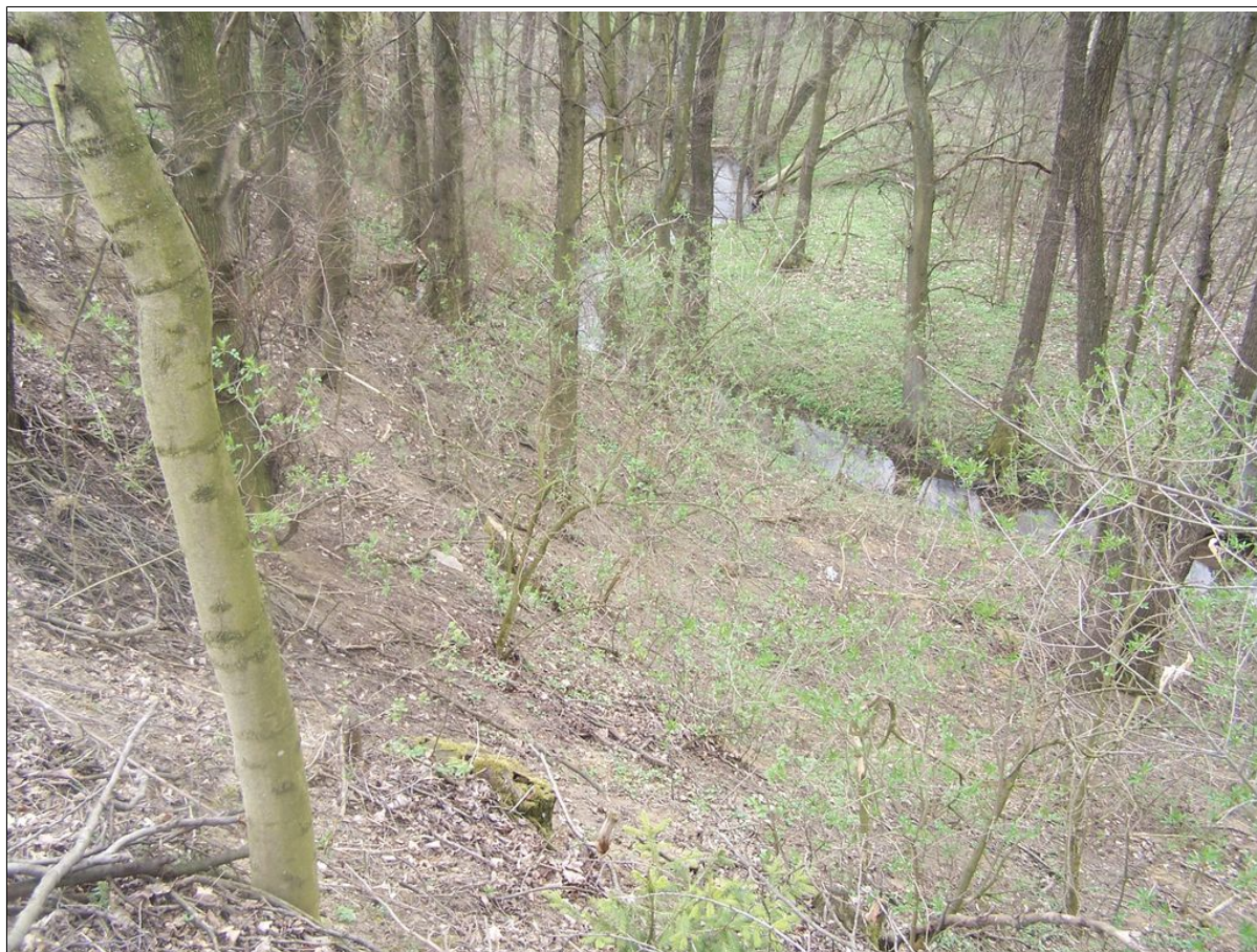
Widok powierzchni koluwialnej, w tle koryto Ciekącej.