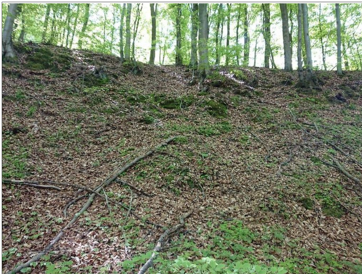
Skarpa górna osuwiska.