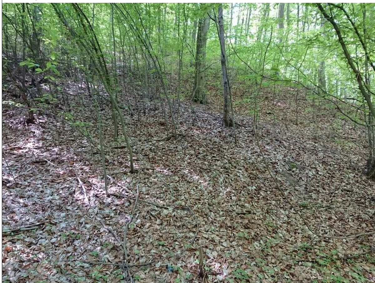
Widok powierzchni koluwialnej.