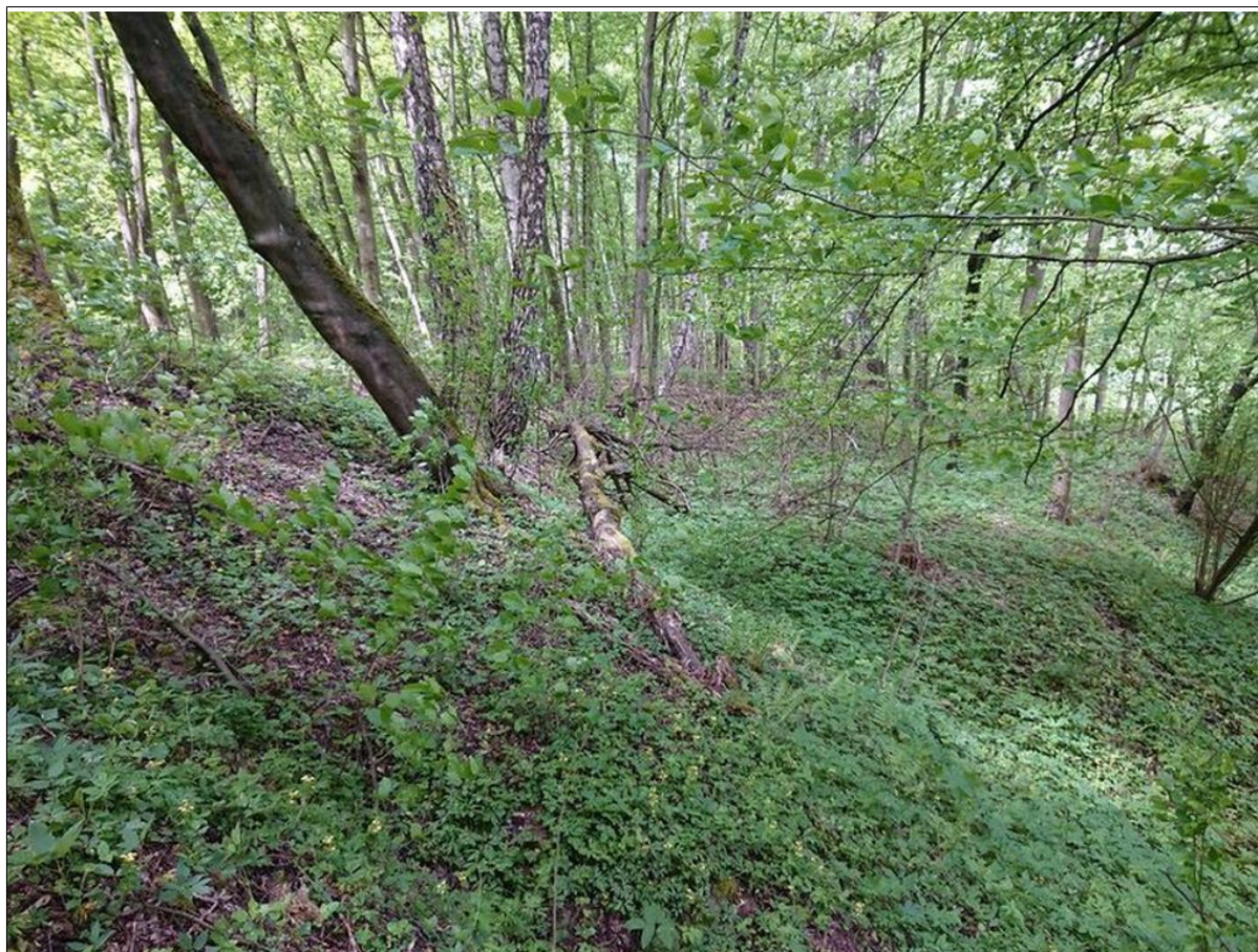
Widok z nad skarpy górnej osuwiska.