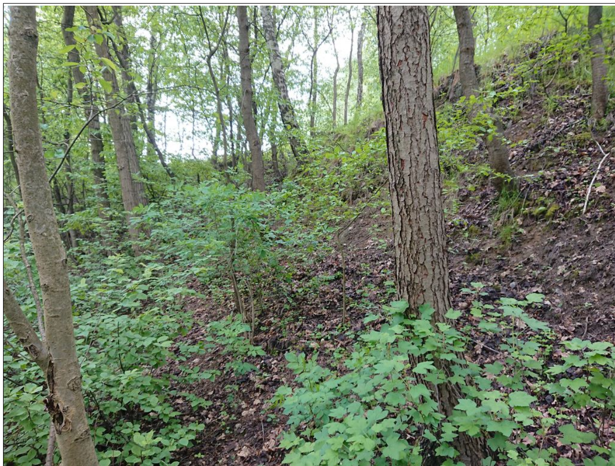
Fragment powierzchni koluwialnej, w tle skarpa górna.